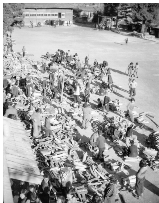
ストーブの薪を用意する中学生 1952(S27)年 会地村