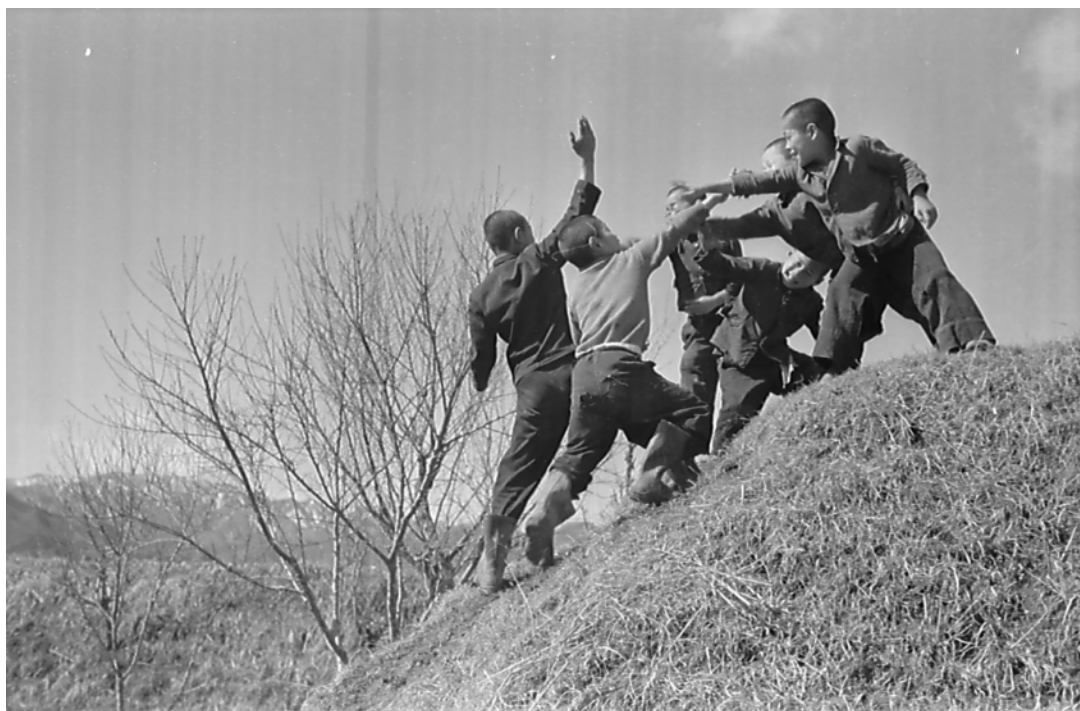
春の丘・土手で遊ぶ 1954(S29)年 会地村

陽のあたる土手はわんぱく達の絶好の遊び場だ。目印になる基地を決めて戦いごっこに興じる。子ども達も多くテレビもゲーム機もなかった時代。