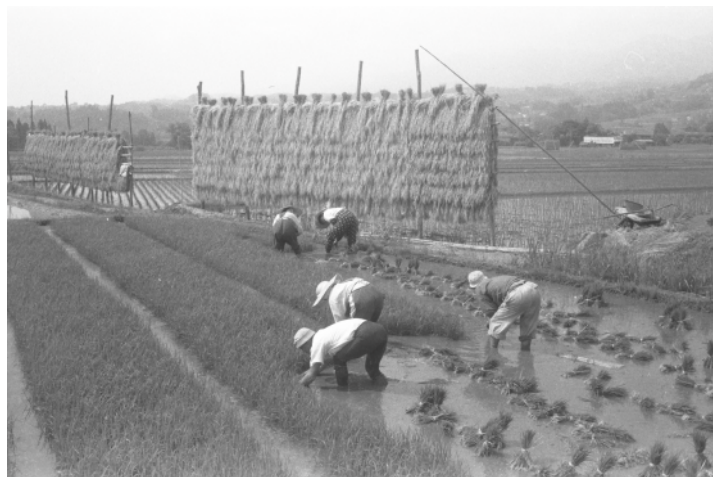
苗取りの家族 1958(S33)年 阿智村駒場

単に過去を懐かしむだけの歴史の写真ではなく、様々な憂慮を抱える現代社会を考える一つの羅針盤になると思います。生活様式や文化を振り返ることで、私たちが直面している環境問題や社会的な課題に気づくことができます。村民にとっては身近な写真が多いので「懐かしい」で済んでしまいがちですが、「懐かしい」にとどまらない価値を見出すことが大事だと思います。