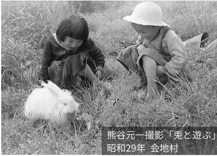
「兎と遊ぶ」 昭和29年 会地村